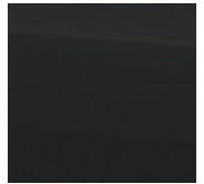
KOLOR LAKIERU: Cosmic Black Pearl (ZCE)